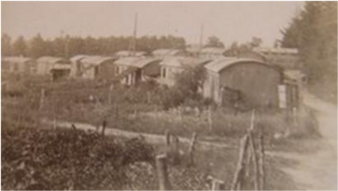
Le quartier des baraques vers 1930