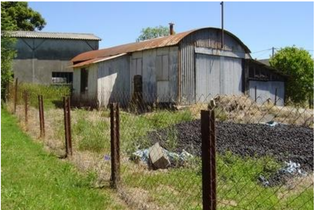
Baraque : état 2008, transformée en garage.