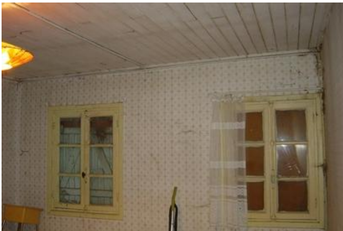
Baraque : pièce latérale, état 2008.