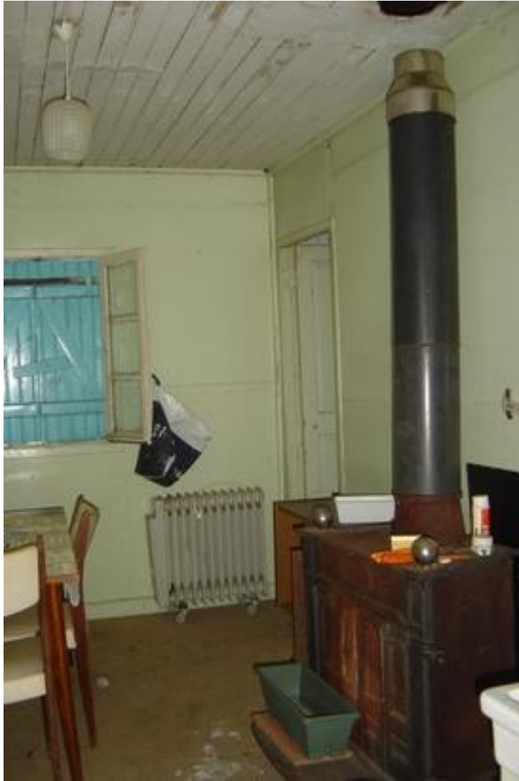
Baraque : pièce axiale avec son poêle à charbon, état 2008.