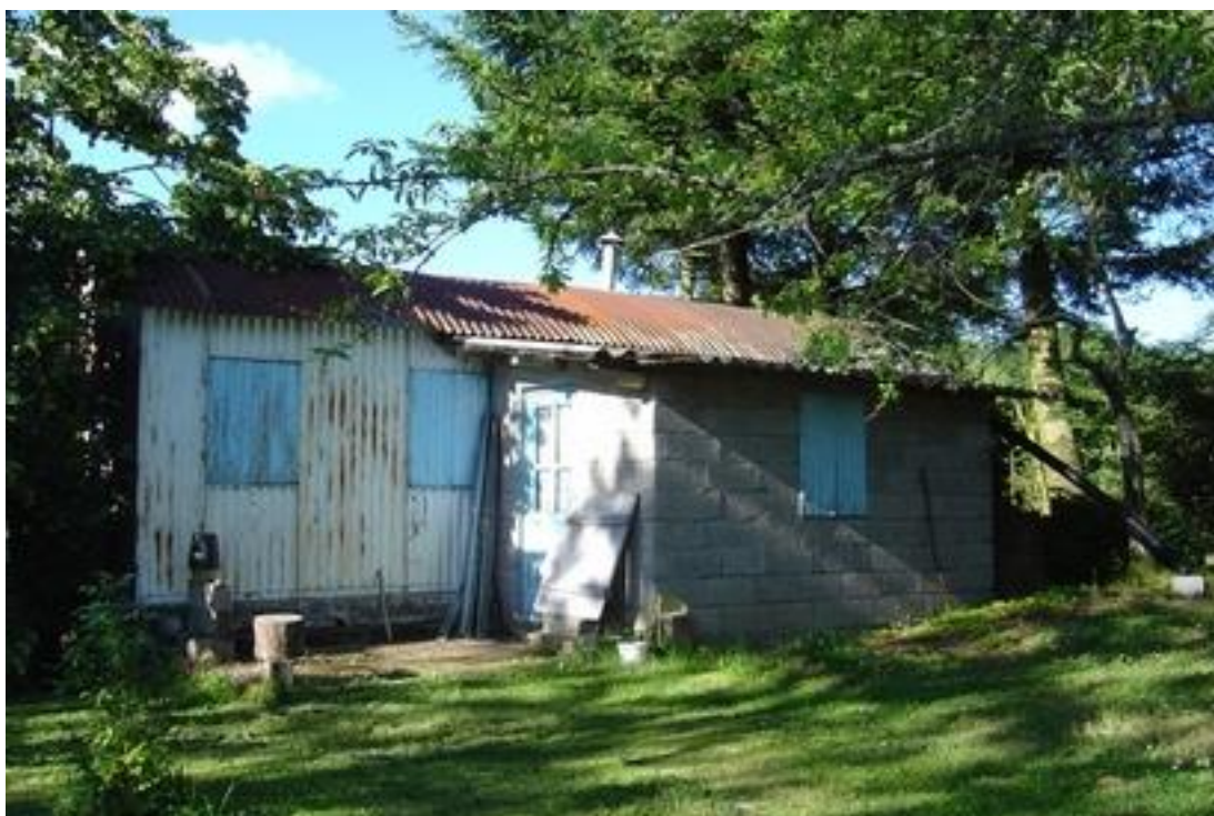
Baraque : état 2008, restée habitée comme résidence secondaire jusqu'à une date récente.